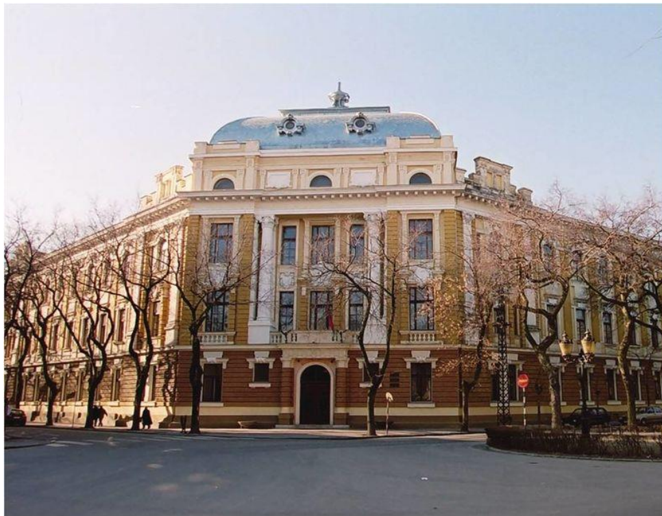
Гимназија „Светозар Марковић“

Школске 2019/20. године школу похађа 865 ученика, распоређених у 37 одељења (26 на српском, 7 на мађарском и 4 на хрватском наставном језику). Наставнички кадар броји 82 професора.